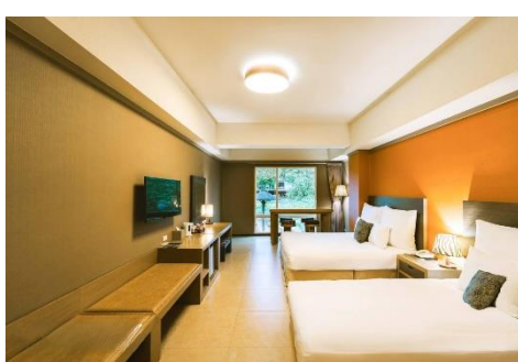
【桃園】 關西六福莊度假酒店