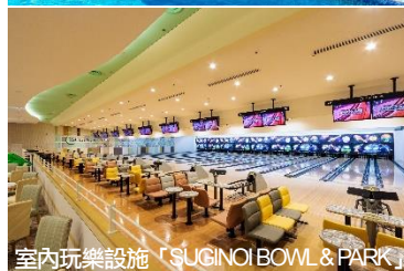
室內玩樂設施「SUGINOI BOWL & PARK」