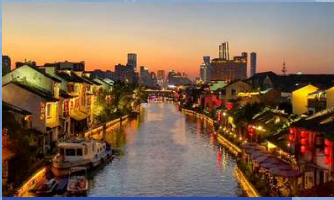
江南水弄堂【南長街歷史文化街區】

位於中國江蘇省無錫市梁溪區，是無錫著名的古街，也是國家4A級旅遊景區。它依傍著京杭大運河，保留了大量的明清建築，展現了典型的江南水鄉風情。南長街是清名橋歷史文化街區的核心部分，與運河、南下塘等區域共同構成了一個富有歷史文化底蘊的街區。