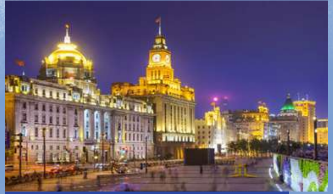
萬國建築博覽群【黃埔江外灘】

位於中國江蘇省無錫市梁溪區，是無錫著名的古街，也是國家4A級旅遊景區。它依傍著京杭大運河，保留了大量的明清建築，展現了典型的江南水鄉風情。南長街是清名橋歷史文化街區的核心部分，與運河、南下塘等區域共同構成了一個富有歷史文化底蘊的街區。