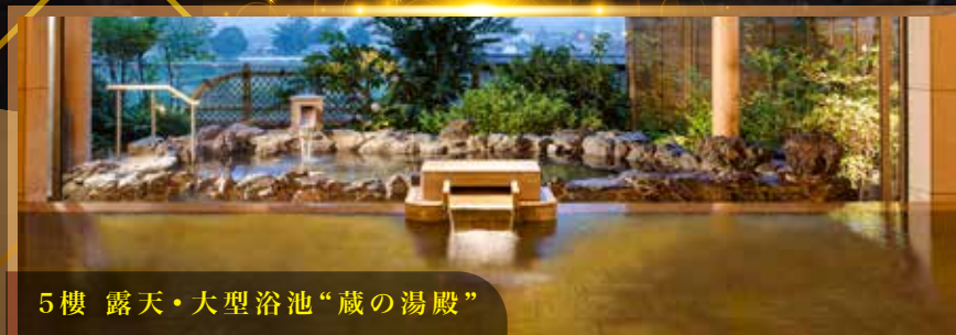
5樓 露天・大型浴池“蔵の湯殿”

為同區內數一數二的高級溫泉旅館。已連續多年選為日本旅館百選之一。內有多個露天大浴場，除了可欣賞南九州山脈的美景外，還設有多款溫泉設施，包括檜木、岩石、陶瓷風呂、仰臥風呂、足湯等等。