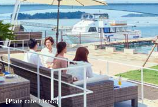
【Plate cafe L'isola】