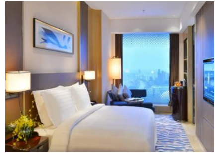
【大連】 大連體育中心皇冠假日酒店 (約 610 呎)

是當地唯一一家豪華酒店。交通便利，距萬達廣場僅 700 米，安東老街僅 400 米，毗鄰鴨綠江斷橋等景點。