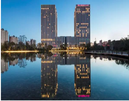
【哈爾濱】 松北融創皇冠酒店 (約 360 呎)

酒店位哈爾濱新區-松北區，地處哈爾濱融創文化旅遊城。酒店設備健身中心、室內恆溫泳池及瑜伽室，令客人身心得到充分的舒展和放鬆