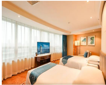
【齊齊哈爾】 和美國際酒店 (約 360 呎)

酒店位哈爾濱新區-松北區，地處哈爾濱融創文化旅遊城。酒店設備健身中心、室內恆溫泳池及瑜伽室，令客人身心得到充分的舒展和放鬆