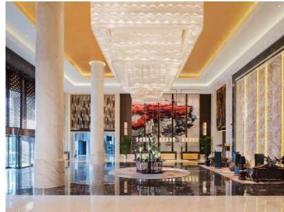
【丹東】 富力萬達嘉華酒店 (約 400 呎)

擁有 340 間的客房，每間均配備喜來登獨特的睡眠體驗床品，提供更加舒適、便捷的設施與服務。