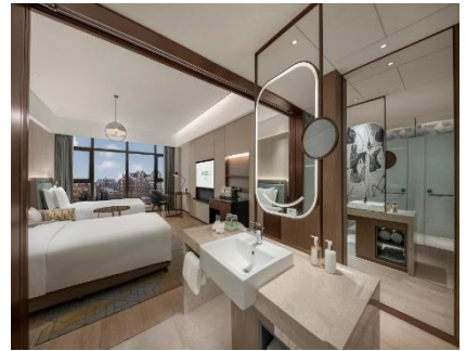
【長春】 淨月假日酒店 (約 530 呎)

落於市中心，與百年公園兩兩相望，鬧中取靜。酒店交通便捷，周邊匯聚多個大型商超，購物生活輕鬆愜意。與人氣的烤肉美食一條街步行僅 3 分鐘，即可暢享舌尖盛宴。