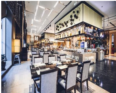
【丹東】 富力萬達嘉華酒店 (約 400 呎)

洲際旗下飯店，位置絕佳，步行即可抵達盤錦行人廣場和新購物商場。房間寬敞舒適，配備了液晶電視、衛星頻道，更備有室內游泳池。