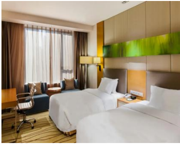
【盤錦】 水遊城假日酒店 (約 270 呎)

酒店位於南關嶺商業圈，毗鄰大連市體育中心，交通便捷，地理位置優越。擁有 427 間現代風格的寬敞客房。