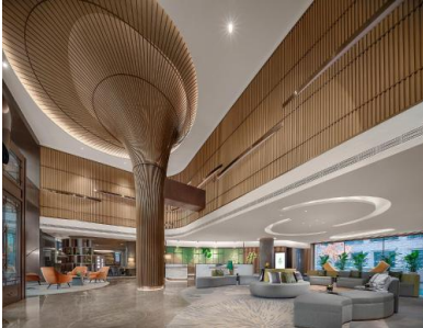
【長春】 淨月假日酒店 (約 530 呎)

擁有 340 間的客房，每間均配備喜來登獨特的睡眠體驗床品，提供更加舒適、便捷的設施與服務。