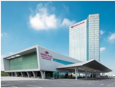
【大連】 大連體育中心皇冠假日酒店 (約 610 呎)

酒店位於南關嶺商業圈，毗鄰大連市體育中心，交通便捷，地理位置優越。擁有 427 間現代風格的寬敞客房。