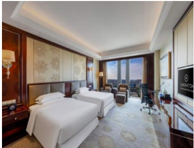
【瀋陽】 新都綠城喜來登酒店 (約 420 呎)

是當地唯一一家豪華酒店。交通便利，距萬達廣場僅 700 米，距安東老街僅 400 米，毗鄰鴨綠江斷橋等景點。