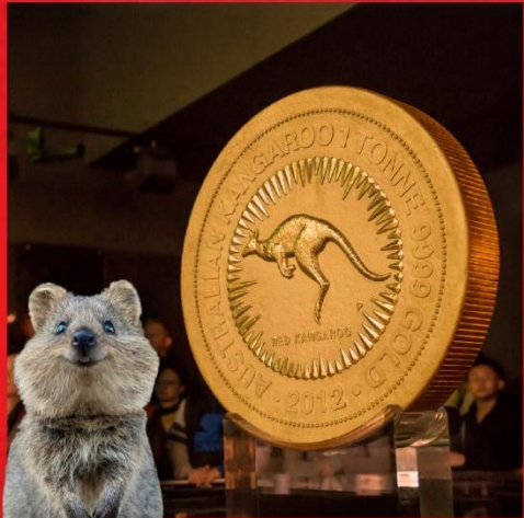
← 探訪微笑袋鼠 Quokka

[8天][慢活親子樂]國泰直航, 海陸空粉紅湖雙體驗, 健力士紀錄鑄幣廠 [6大親子]BUGGY車袋鼠追蹤, 探訪微笑袋鼠QUOKKA, 親親國寶樹熊, 頂級CROWN TOWER海鮮自助餐, 2晚珀斯天鵝谷NOVOTEL渡假村