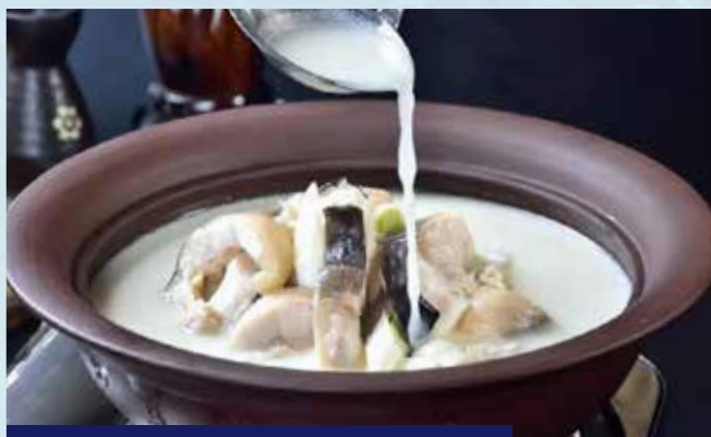
【放翁酒家】享用長江肥魚宴

全球九大岩洞餐廳之一，建在懸崖邊的餐廳。將三峽歷史人文與本土餐飲文化完善融於一體，集巴楚山珍野菜之靈氣，推出招牌菜肴長江肥魚。