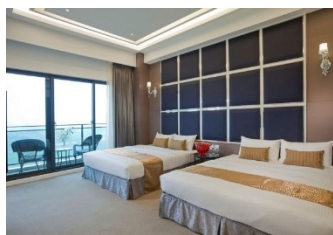
【嘉義】 仁義湖岸大酒店