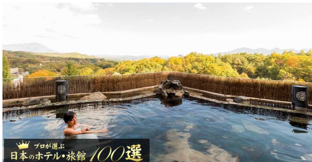
プロが選ぶ 日本のホテル・旅館 100選