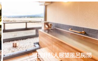
可提升私人展望風呂房間