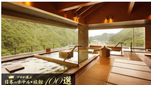
プロが選ぶ 日本のホテル・旅館 100選

磐梯熱海溫泉地處東北地區的南門口、被稱作「郡山市的內廳」，掩映在安積村茂密的樹林中，有清清溪流潺潺流過。華之湯飯店就位於此，於 2009 年 10 月 1 日，90 間客房全面裝修後重新開放，更加溫馨舒適。設有 30 種浴池，為您帶來情趣各異的完美體驗。多個展望溫泉，當中部份加入了天然石、備長炭等等的特別溫泉，亦有庭園景致的露天風呂。