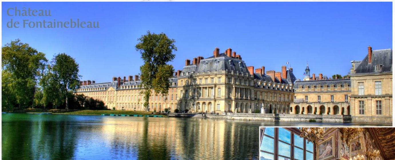
Château de Fontainebleau