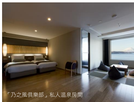
「乃之風俱樂部」私人溫泉房間