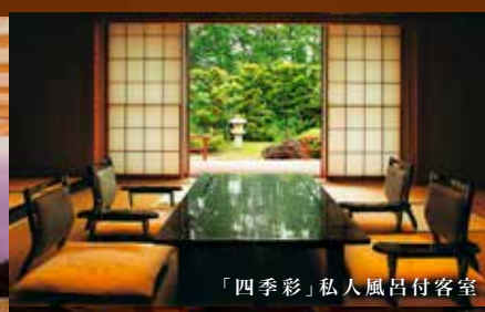
「四季彩」私人風呂付客室