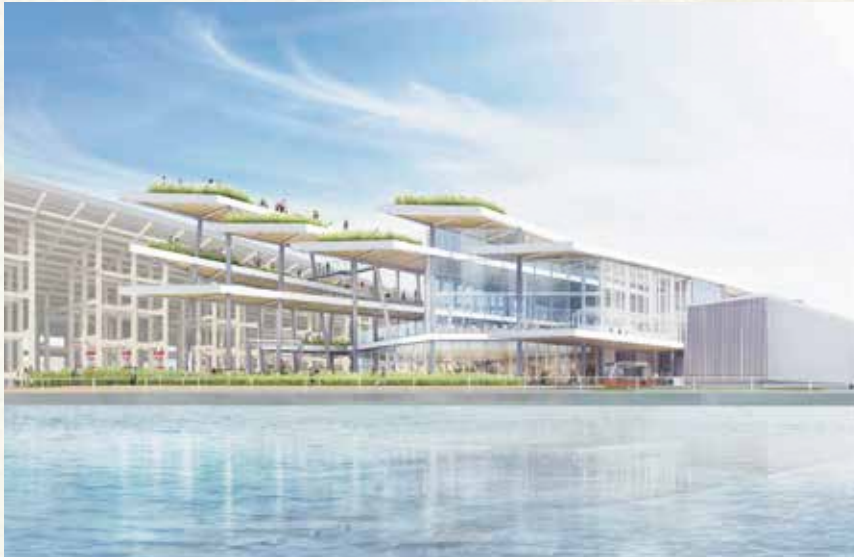
縱橫遊 WWPKG與博覽會協會簽有買取票券販售之契約。