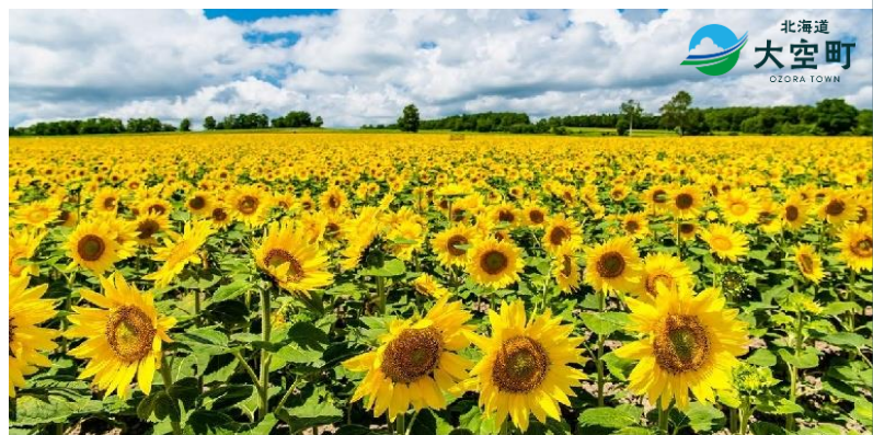
北海道 大空町 OZORA TOWN