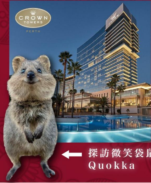
← 探訪微笑袋鼠 Quokka

[8天][國泰直航]西澳珀斯, 飛機遊粉紅湖, 獵犬黑松露探索之旅, 提升珀斯5星CROWN TOWERS & PULLMAN BUNKERS BAY 400呎露台房間, 西澳岩龍蝦, 即捕即食龍蝦海鮮盛宴, 360旋轉餐廳C RESTAURANT