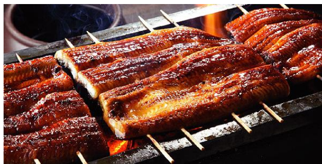
※圖片僅供參考，餐食以當天接待為準。

名古屋出名鰻魚飯，鰻魚用備長炭燒成，精準的控制火候技術，令每條鰻魚都燒得恰到好處，沒有半點焦掉部分，再加上秘製醬汁，令人回味無窮，感受由肥滿鰻魚、飽滿白米以及濃郁醬汁形成的絕佳的平衡，連當地人亦十分推薦，是名古屋必食名物首選。