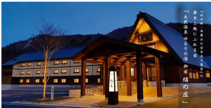
「白川郷、五箇山の合掌造り集落」の歴史と趣にふれる宿 「天然温泉ゆるりの湯 御宿 結の庄」

使用當季最新鮮食材製作的和食會席料理，從在地的鄉土料理到岐阜縣必吃飛驒牛，都能在晚餐中品嚐。早上提供飛驒傳統鄉土料理「朴葉味噌」，會將當地自產的味噌放置在朴葉上進行燒烤。完成後可將蔬菜、肉品蘸點味噌享用。吃起來富有層次還能品嚐到朴葉香氣。