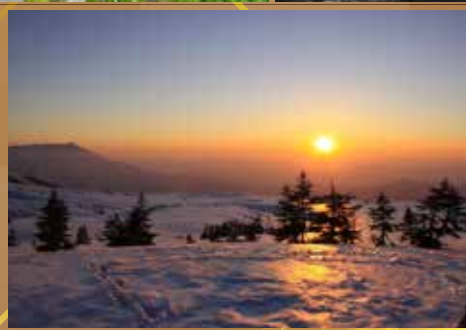
海拔1930米・近距離觀賞星空銀河

酒店內用的水都是附近天狗山的湧泉，是當地非常自豪的名水，而大浴場採用落地大玻璃，可以一邊舒舒服服的泡澡，一邊享受大日連峰的美景，視野絕讚！