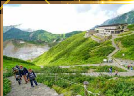
變化萬千的富山平原雲海