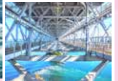
上空欣賞鳴門漩渦