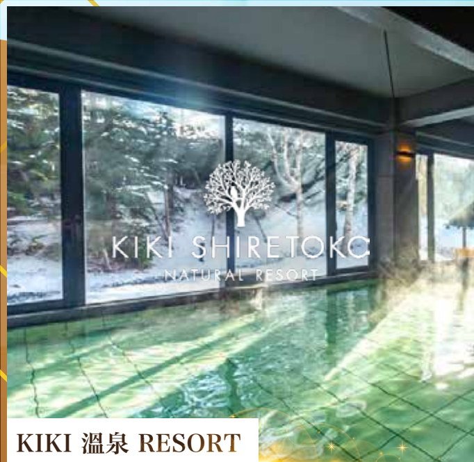
KIKI 溫泉 RESORT