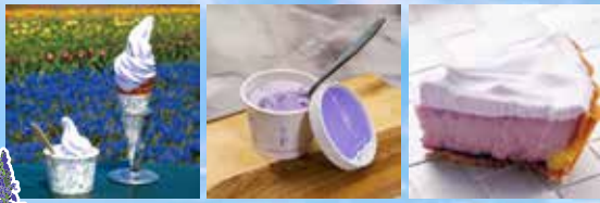
可自行購買必嗜薰衣草製甜品