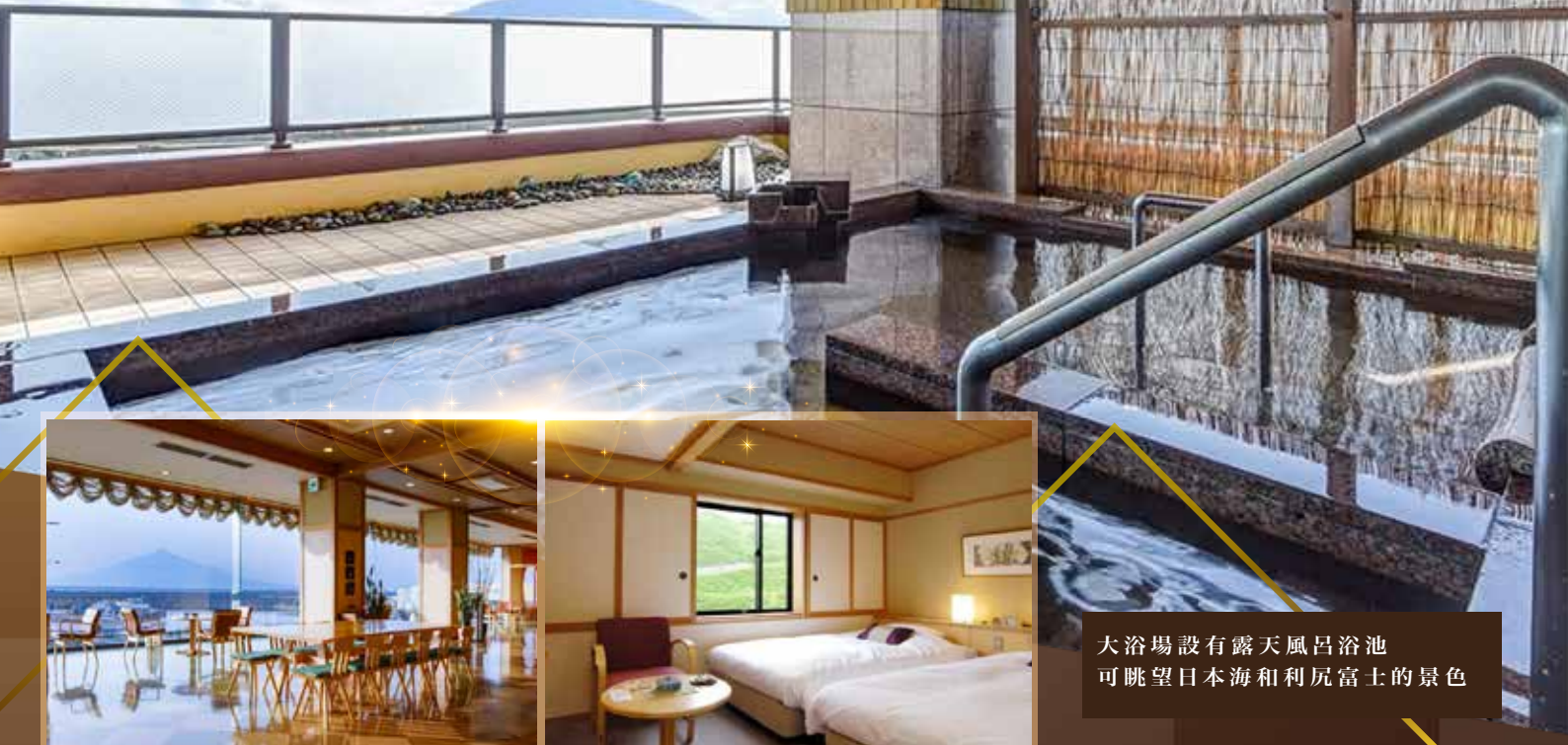
大浴場設有露天風呂浴池 可眺望日本海和利尻富士的景色

日本最北端的傳統日式旅館，放眼望去，部分客房可看到浮在海面、雄偉壯麗的利尻富士，讓隨季節變化的藍天大海景致與豐富的大自然，為旅途增寄添色彩。館內更附有大浴場和露天浴池，溫泉水都是從天然溫泉薄雪溫泉直接引來的。客人可望著浮在海上的利尻富士泡泡溫泉，即可解乏，放鬆身心。