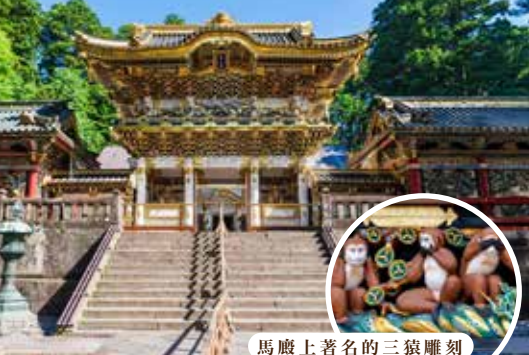
馬廐上著名的三猿雕刻