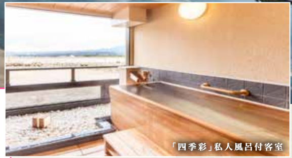
「四季彩」私人風呂付客室