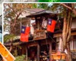
特別安排品嚐必食名物 飛天糰子(每人1串)

磐井川將嚴美溪中的巨大岩石侵蝕，經歷數萬年造成了許多奇岩怪石，全長10公里的溪谷可以欣賞到各種不同表情的巨岩，險峻的奇岩與清澈的溪流交織成絕美的川岸景象，上流激流湍急，下流則平穩澄靜。其天然美景，有日本第溪之讚譽。