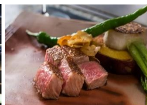
※圖片僅供參考，餐食以當天接待為準。