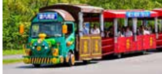
特意贴心安排乘坐特色觀景火車 讓您輕鬆遊覽美景！

位於茨城縣常陸那珂市太平洋沿岸邊，曾被CNN評選為日本「一個絕美景點之一」。別於東京的擁擠，佔地200公頃的瞭闊公園一年四季都有截然不同的花草和大自然奇觀可供欣賞，園內也有小朋友喜歡的小火車造型的遊園車。除此之外，也相當適合喜歡拍照的女生們，來這邊賞花、拍照，不需要專業攝影師，美景讓每張照片都像外拍一樣夢幻！