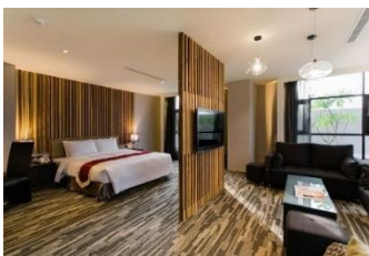
📍【嘉義】 東方明珠國際大飯店