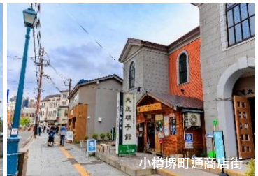
小樽堺町通商店街