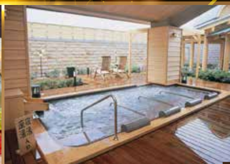
↑可每位每晚HK$1500提升「松屋千千」私人露天風呂房間