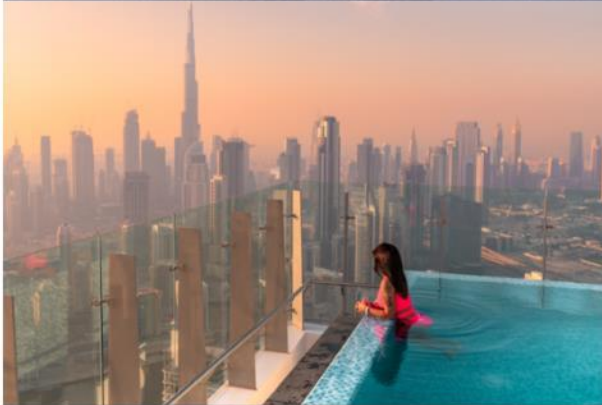
健力士世界紀錄最高無邊際泳池

官方網頁： https://slshotels.com/dubai/rooms-and-suites/