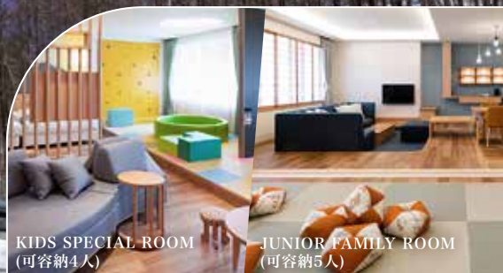
KIDS SPECIAL ROOM (可容納4人)