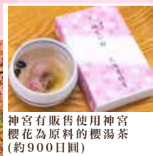
神宮有販售使用神宮櫻花為原料的櫻湯茶(約900日圓)

【4月下旬至5月上旬賞櫻】北海道神宮坐鎮於圓山公園內,為北海道的開拓及發展的守護之神,供奉著包括明治天皇在內的四尊神,亦是北海道最多人參拜的神社。