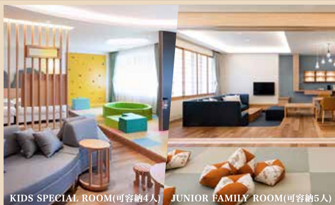
KIDS SPECIAL ROOM(可容納4人) JUNIOR FAMILY ROOM(可容納5人)

↑ 房間提升 可每位每晚HK$1000提升 家庭房FAMILY/KIDS ROOM(房間約760呎)