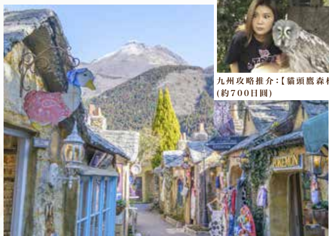
九州攻略推介：【貓頭鷹森林】 (約700日圓)

悠閒感受、拍攝約12棟懷舊復古歐式建築，可以自行前往JR門司港駅(於1914年落成的車站，已被日本政府指定為重要文化遺產)、舊三井俱樂部博物館(保留著愛因斯坦夫婦赴日演說期間住過的房間)、九州鐵道紀念館、舊大阪商船分店、國際友好紀念圖書館等明治至大正時期歷史建築。