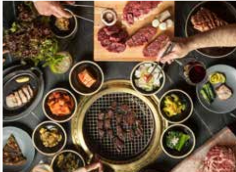
來韓必食·韓式烤肉放題

可每位每晚HK$600提升入住Premier Botanik Suite露台房(1廳2房，每房1張雙人床，約450呎)，11歲以下(不佔床)小童沒有額外收費。