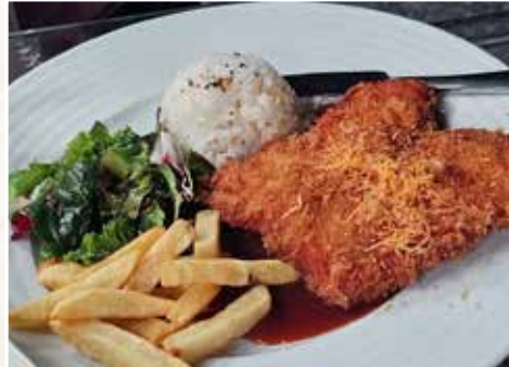
水族館 Café·吉列豬排定食