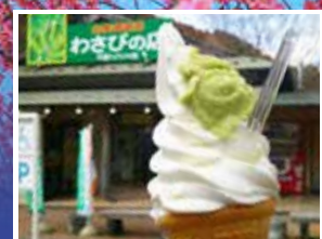
可前往【天城 WASABI 之鄉】品嚐多種清甜可口的 WASABI 口味食品

【熱海梅園祭】以號稱日本第一的早開梅花而著稱的梅園。每年11月下旬開始，第一批梅花先綻放，之後按早、中、晚依次開花至3月，熱海梅園有白梅、紅梅、混色梅、泛綠的白梅，各種各樣的梅花，令人流連忘返。