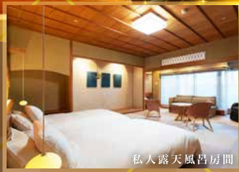
私人露天風呂房間