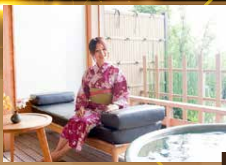
↑ 可以每位每晚HK$1500提升「松屋千千」私人露天風呂房間