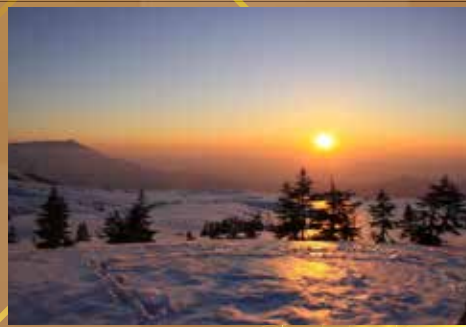
海拔1930米・近距離觀賞星空銀河

酒店內用的水都是附近天狗山的湧泉，是當地非常自豪的名水，而大浴場採用落地大玻璃，可以一邊舒舒服服的泡澡，一邊享受大日連峰的美景，視野絕讚！