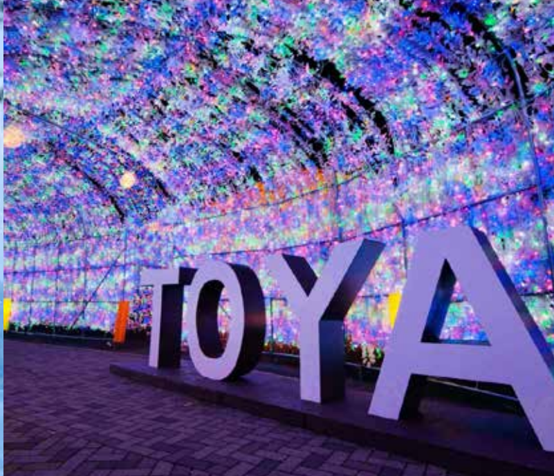
40萬顆彩燈編織出的夢幻般氛圍

北海道南部的具有代表性的旅遊景地。從船上可盡情享受羊蹄山，昭和新山，有珠山等洞爺雄偉的大自然風光，湖水清澈見底，景色壯麗迷人。