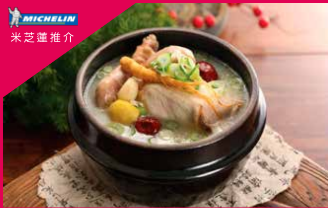
百年滋補人蔘雞湯