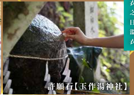
許願石【玉作湯神社】

玉造溫泉街非常鼓勵溫泉客穿着浴衣在溫泉街上散步。行程中所安排之3間溫泉旅館可以約500-1000日圓租借。穿上浴衣，讓你更能享受溫泉的樂趣。※部分酒店的顏色浴衣只提供女士及小朋友樣式