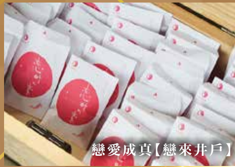
戀愛成真【戀來井戶】