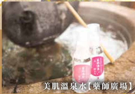
美肌溫泉水【藥師廣場】