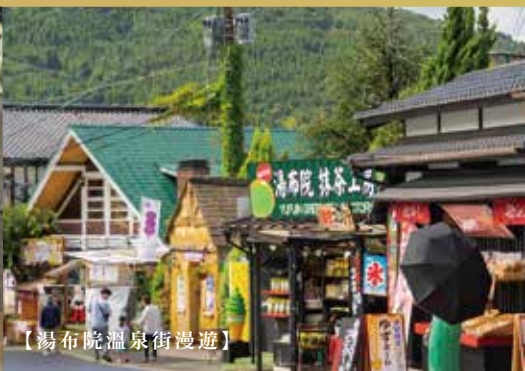
【湯布院溫泉街漫遊】

湯布院是九州非常有名的溫泉小鎮，跟一般的溫泉小鎮不太相同，湯布院經過悉心打造成十分具有藝術氣息的小鎮，特別受到日本OL女士的追捧。自由在湯布院溫泉街上漫遊，可前往SNOOPY茶屋、金鱗湖等等。