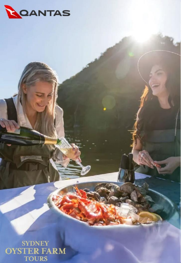
SYDNEY OYSTER FARM TOURS