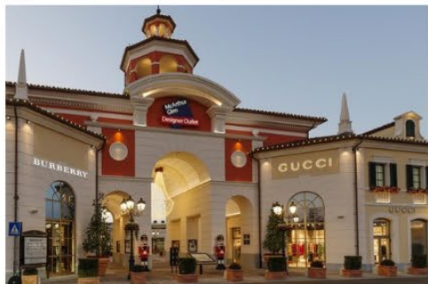
米蘭塞拉瓦萊名品購物村 Serravalle Designer Outlet

被譽為歐洲最大名牌折扣Outlet 有超過 230 名店進駐，知名品牌 Prada、D&G、Gucci、Armani、Bulgari、Burberry 都可找到。