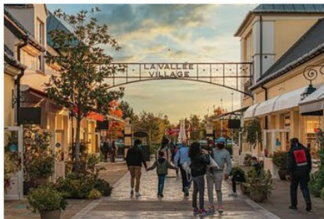
巴黎河谷購物村 La Vallee Outlet

被譽為歐洲最大名牌折扣Outlet 有超過 230 名店進駐，知名品牌 Prada、D&G、Gucci、Armani、Bulgari、Burberry 都可找到。