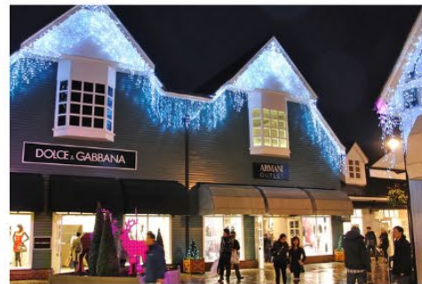
倫敦比斯特購物村 Bicester Village Outlet

擁有 120 多家來自法國和國際最令人興奮的設計師的精品店，全年都以令人難以抗拒的價格出售較前系列的產品。