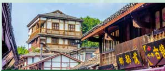
「國家4A級景區」磁器口古鎮

又稱為「幽都」、「中國神曲之鄉」，相傳是酆都大帝與十殿閻君管理諸鬼之所。已有2千餘年的歷史。從神話傳說到陸續用實物建造將建築、雕塑、繪畫等多種藝術形式結合起來，形成了獨樹一幟的鬼城文化。