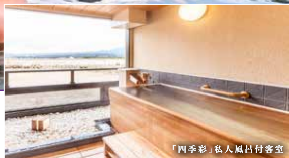
「四季彩」私人風呂付客室