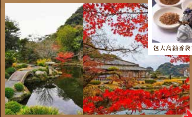
包大島紬香袋製作體驗

建於福岡城遺跡之上，四時變幻的自然之美，是福岡市民休憩的場所。秋季的紅葉美景十分有名，紅色的楓葉及黃色的銀杏妝點在城牆周圍，形成色彩豐富的美麗景觀，別有風味。