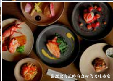
嚴選北海道時令食材的美味盛宴