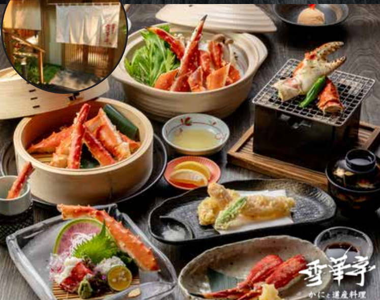
雪華亭 かにと道産料理