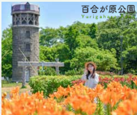
百合が原公園 Yurigahara Park

約1200本の梅の木が植えられており、紅梅と白梅の比率は4対6です。5月の花期には、紅梅と白梅の幻想的な色合いが草地の緑と空の青と相まって、北海道の遅い春を感じることができます。