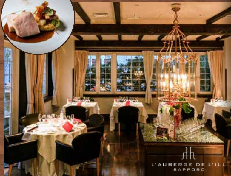
L'AUBERGE DE L'ILL SAPPORO