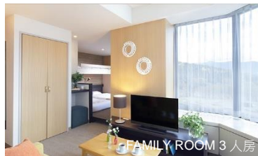
FAMILY ROOM 3 人房

適合與家人或摯友一同出行的旅客，共度溫馨時光。在客廳區配備舒適的沙發以供休閒和休息。更設有特大玻璃窗，可於寧靜及時尚的客房內俯瞰整個 TOMAMU 的雄偉風景。