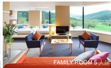
FAMILY ROOM 5 人房