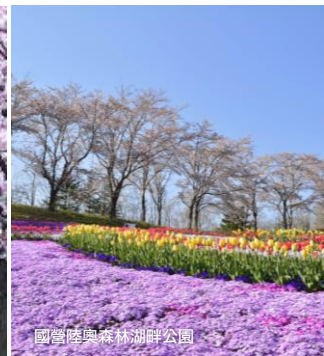
國營陸奧森林湖畔公園