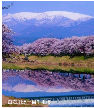
白石川堤一目千本櫻

白石川堤防上種植約1,200棵、以染井吉野為主的櫻花道「一目千本櫻」，以藏王連峰為背景，綿延約8公里。白石川的清澈湛藍和千本櫻的華麗桃紅，再搭上藏王連峰的白靄殘雪，三色交織的風景，是只有這裡才欣賞得到的絕美景致。