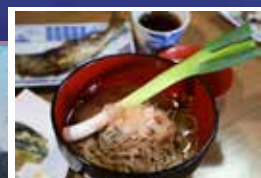
可品嚐當地必食名物-使用大蔥代替筷子的「大蔥蕎麥麵」(約1320日圓)

大內宿作為連接會津若松和栃木縣今市的旅館街而得到了繁榮發展，至今仍留存了昔日的茅草屋，即使在今天依然能感受18世紀的旅館街的風情。與京都的美山和白川鄉的合掌村齊名，被譽為日本三大茅草屋聚落，同時亦被指定為重要傳統建築物保存地區。