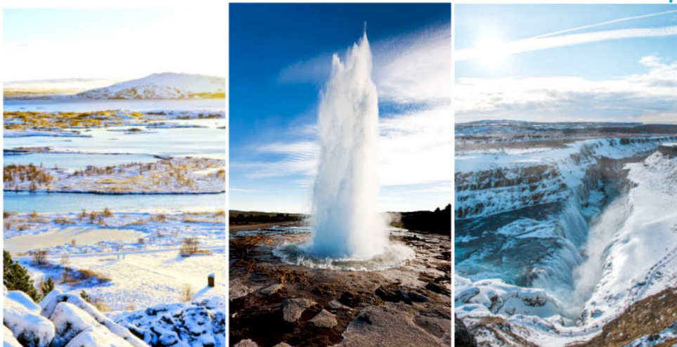
環遊平格費利爾國家公園、間歇噴泉、黃金瀑布，三個重量級著名自然景點